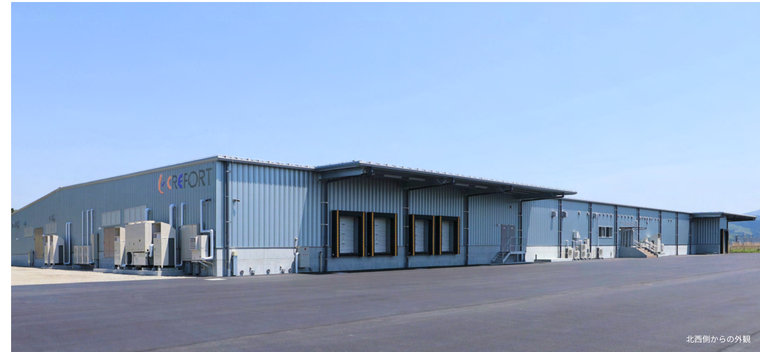
北西側からの外観

卵を割卵し、液卵となった卵にステンレスタンク（上部）にて出汁やタレを混合します。すべてはパイプラインで接続されており、最後は焼成室にて玉子焼として製品化されます。下部のタンクは洗浄液が入っており、1日1回、約3時間程かけてパイプラインの中を一筆書きのようにすべて綺麗にすることで、徹底的な品質管理を行っています。