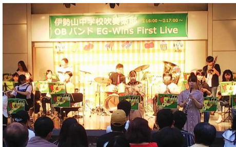
大学1年生のとき、アスナル金山で中学卒業生バンドとして出演