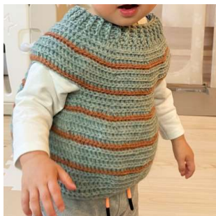
バルーンベスト