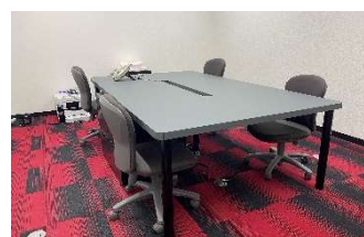
原田商事ビル 3階(小)会議室