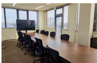
原田商事ビル 3階(大)会議室