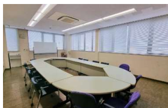
原田商事ビル 6階会議室